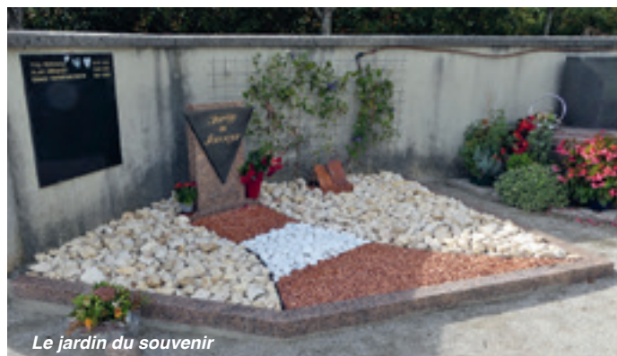
Le jardin du souvenir

• Le jardin du souvenir est un espace aménagé destiné à la dispersion (gratuite) des cendres des personnes qui ont fait le choix de se faire incinérer (pas d'urne). Sur une plaque commune, les familles peuvent faire inscrire les noms des défunts.