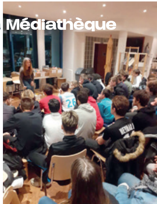
Photo prise avant la crise sanitaire

La collaboration s'étend également au collège avec le documentaliste dans le cadre d'animations ponctuelles pour le Salon du Livre et à la MFR avec des soirées thématiques (contes, nouvelles) organisées à la Médiathèque avec les enseignantes de français.