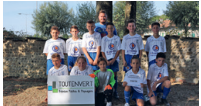
Une équipe chattoise présente au tournoi.

En parlant de bons gestes, les jeunes licenciés ont reçu une démonstration de nettoyage des équipements et de sensibilisation à la gestion de l'eau par l'équipe Tiraka. Une action menée dans le cadre des programmes éducatifs de la Fédération Française de Football.