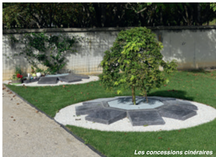
Les concessions cinéraires

Tous les travaux réalisés sur une concession par un particulier ou une entreprise doivent obligatoirement être déclarés en mairie.